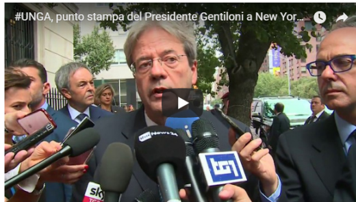
Paolo Gentiloni a New York

NOI RIPORTIAMO I FATTI. A PENSARE CI PENSATE VOI.