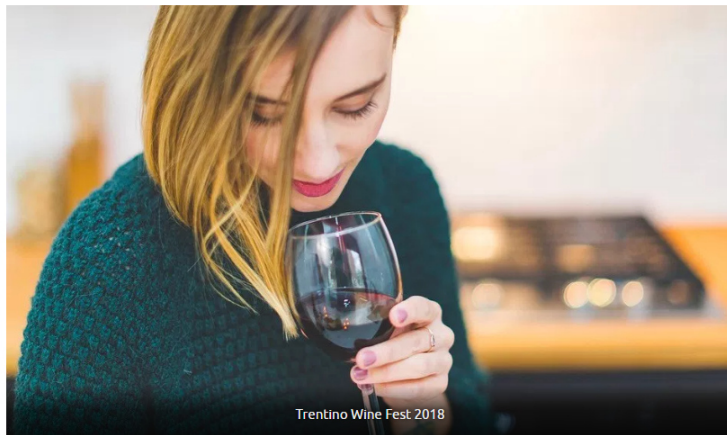
Trentino Wine Fest 2018

Nosiola e Vino Santo, Müller Thurgau, Teroldego Rotaliano, Marzemino, Trentodoc, grappa: questi i protagonisti indiscussi degli eventi territoriali dedicati al mondo del vino , in programma lungo tutto l'arco dell'anno, coordinati e promossi dalla Strada del Vino e dei Sapori del Trentino .