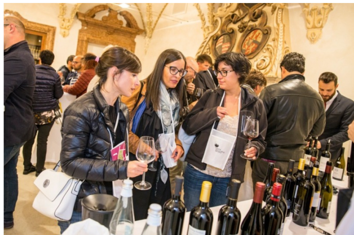
Trento - Nosiola e Vino Santo, Müller Thurgau, Teroldego Rotaliano, Marzemino, Trentodoc, grappa : questi i protagonisti indiscussi degli eventi territoriali dedicati al mondo del vino, in programma lungo tutto l'arco dell'anno, coordinati e promossi dalla Strada del Vino e del Sapori del Trentino.

Il via con DivinNosiola , quando il vino si fa santo, che dai 25 marzo al 25 aprile prevede diverse iniziative enogastronomiche, culturali e sportive concentrate in particolare nella città di Trento e in Valle dei Laghi, luogo di eccellenza per la produzione di Nosiola, la più antica varietà di uva bianca autoctona che dà vita all'omonimo vino, dall'inconfondibile profumo fruttato e gentile, e al Vino Santo, dolce nettare frutto dell'appassimento dell'uva su graticci chiamati "arèie", accarezzati dalla brezza dell'Ora del Garda. Tra i momenti più suggestivi in programma, proprio il rito della spremitura delle uve appassite, che daranno vita alle prime gocce del Vino Santo 2018.