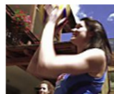
In Val di Fiemme anche le pallavoliste diventano boscaiole