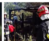
Faida di Pinè, esplosione in un pollaio