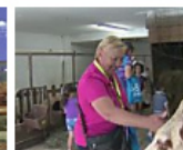
Latte in Festa, è subito pienone