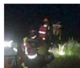
La ricostruzione della sindaco di Valdaone: "Tragedia terribile"